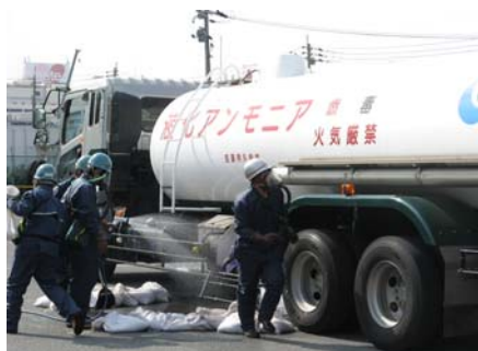
九州支社訓練風景