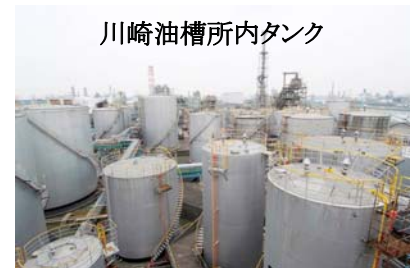
川崎油槽所内タンク