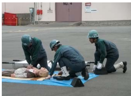
尼崎油槽所訓練風景