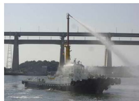
四国支社訓練風景